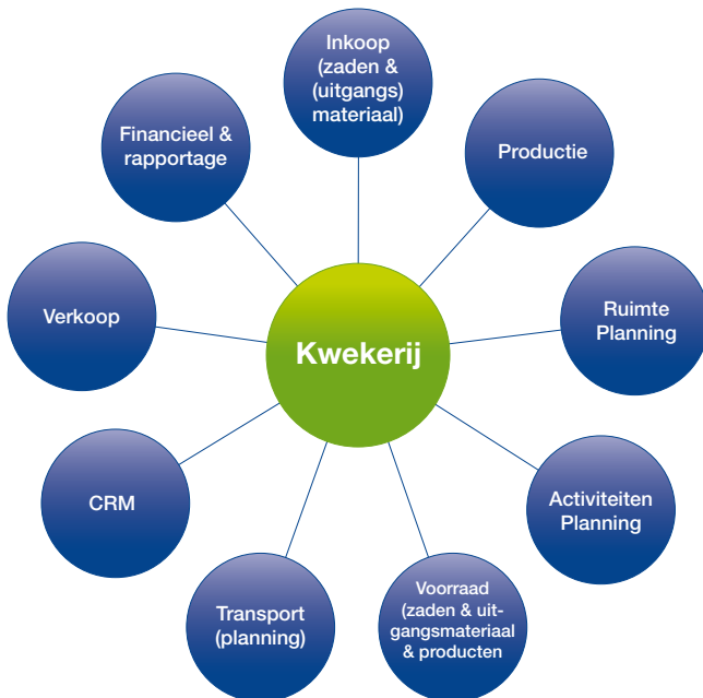
Figuur: overzicht processen